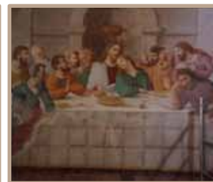
Opere restaurate in occasione della Festa dell'Olio 2015 da Studio Daniele Piacenti.