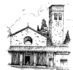
UNITA' PASTORALE DI MONTEMURLO